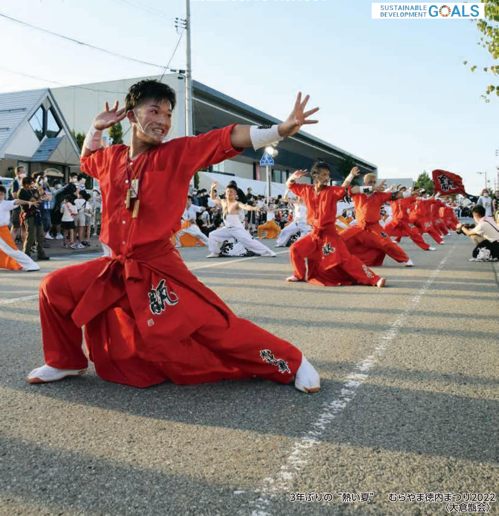
3年ぶりの“熱い夏” むらやま徳内まつり2022 〈大倉薮会〉