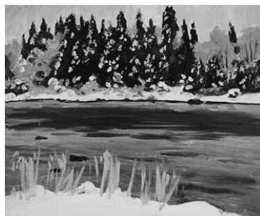
真下慶治作「冬の最上川」

■企画展 居合の祖 林崎甚助重信公生誕480年記念「室町・江戸時代の刀剣展」 林崎甚助重信公が今年で生誕480年を迎えるにあたって、重信が生きた 室町時代から江戸時代に作刀された太刀や打刀などを展示するとともに、居 合に関する資料を紹介します。 期間 10月11日(火)まで