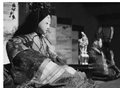
原舟月作の古今雛(江戸時代)