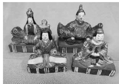
相良人形・内裏雛(江戸時代)