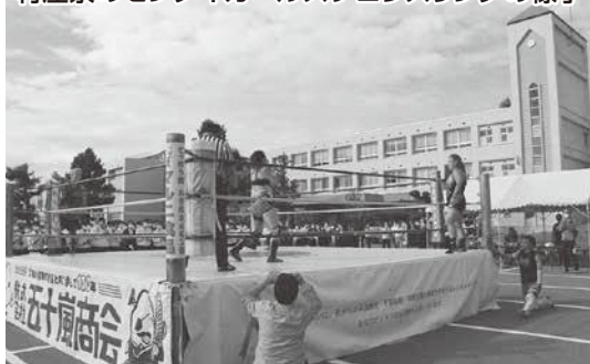
村産祭のセンダイガールズプロレスリングの様子

夏のクラスマッチ では盛りだくさんの種目を各クラスが全力で競い合いました。また、種目の中には今話題のe-スポーツを取り入れるなど工夫した内容となっています。