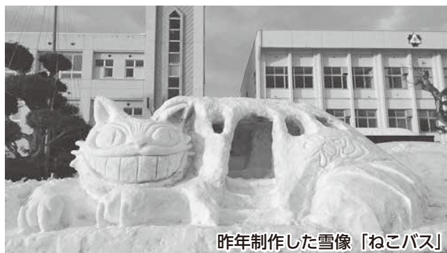
昨年制作した雪像「ねこバス」

このように何事も前向きに、新しい取り組みを全力で楽しみながら生徒会活動を行っている「むらさん生徒会」です。これからもたくさんの楽しさを追い求め、発信していきますので応援よろしくをお願いします。