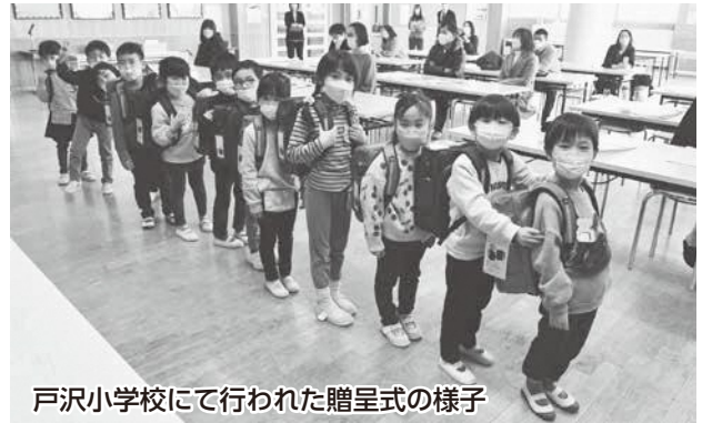
戸沢小学校にて行われた贈呈式の様子