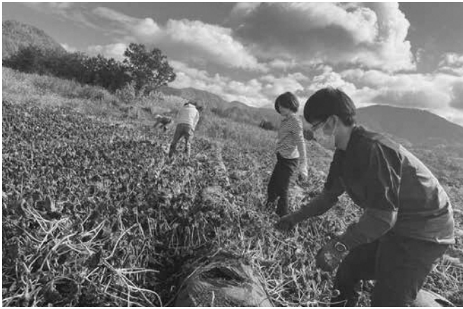
さつまいも畑で作業を楽しむ若者たち