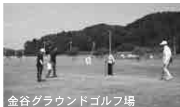
金谷グラウンドゴルフ場