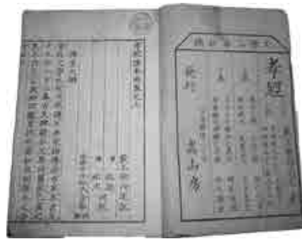
孝経謹奉進 上巻 最上徳内著

最上徳内が書いたとされるこの初稿本は「孝経白文章」と名付けられ、文政二年から八年頃に発行されたといわれています。この上巻は文政十一年春に三条前内大臣に献上されています。 徳内の専門は洋学で、漢学は専門外にあたると思われますが、漢学の方面の著述はこの洋学の知識があったために当時では異色の研究を成し得たものです。このようなどことから、本書は大変貴重なものと言えます。