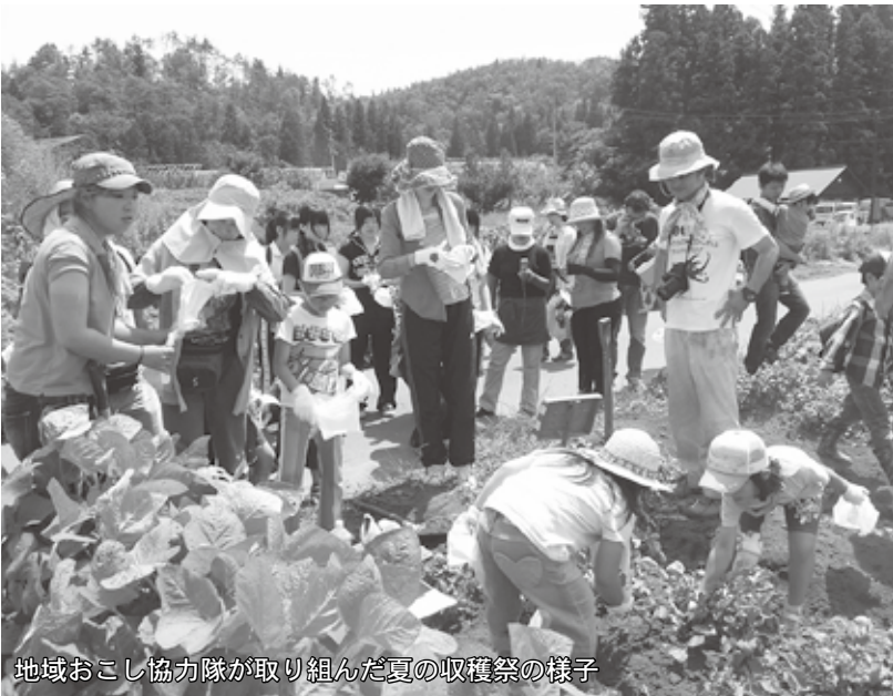
地域おこし協力隊が取り組んだ夏の収穫祭の様子

地域おこし協力隊は、国（総務省）が平成二十一年度から取り組んでいる制度です。県外などの都市住民が住民票を村山市に移し、定住を図りながら地域おこし活動や農林水産業などの「地域協力活動」に貢献してもらうものです。