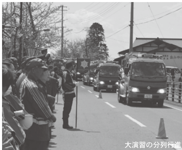
大演習の分列行進