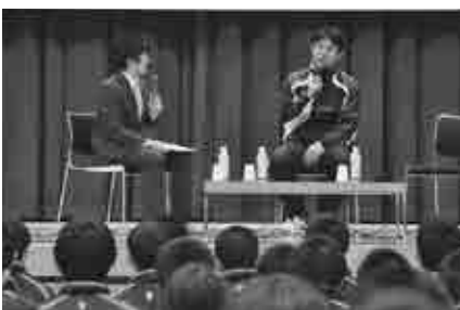
たくさんの人でにぎわう甌葉プラザ

午後からはスポーツクリニックも開催され、中学生たちは仁志さんから直接、バッテリーのフォーミュリズムの取り方などの本格的な指導を受けました。