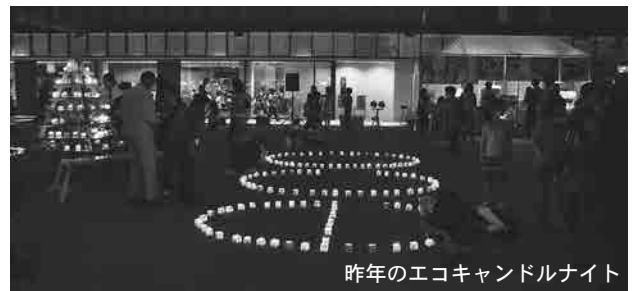
昨年のエコキャンドルナイト

甌葉プラザの名前の由来となった甌岳や葉山の写真も多く展示しますのでぜひご覧ください。