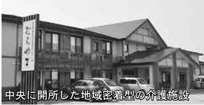
中央に開所した地域密着型の介護施設