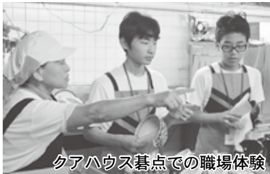
クアハウス基点での職場体験