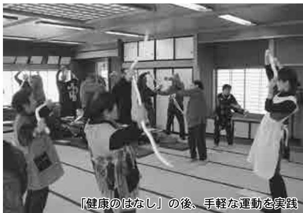
「健康のはなし」の後、手軽な運動を実践