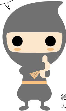
給付金マスコットキャラクター カクニンジャ