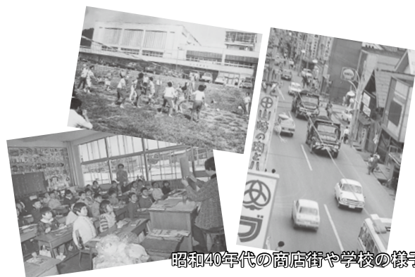
昭和40年代の商店街や学校の様子

村山市は昭和29年11月に1町5村が合併して誕生。さらに2村が合併して現在の姿となり、今年で市制施行60周年を迎えます。市は、これを記念して「村山市60年のあゆみ展」の開催を計画しています。かつての町並みや伝統行事の写真などがありましたらぜひ、お貸しください。 募集期限 8月8日(金)