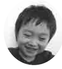
うたに ぎんがくん