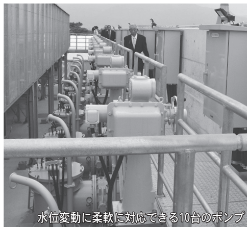
水位変動に柔軟に対応できる10台のポンプ

大旦川と最上川の合流部に新しい「大旦川排水機場」が完成し、六月二十二日、竣工式がおこなわれました。昭和四十七年から稼働してきた旧排水機場の老朽化と、地元南河島地区住民の強い要望により、国土交通省が平成二十三年から改築工事を進めてきました。最大排水量は、これまでとほぼ同等の毎秒十トンの性能ですが、ポンプを三機から十機に増やし、新たに排水量を十段階に調整できるため、水位変動に柔軟に対応した効率的な排水が可能になりました。 竣工式には、関係者ら約五十人が出席。志布市長が「長年、南河島地区の方が要望してきた治水対策がとられることは大変喜ばしいこと。これからも、国や県と連携していきたい」とあいさつしました。その後、代表者七人が完成した排水ポンプの稼働ボタンを押し、新しいポンプが動き始めました。