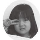
かなや のかちゃん