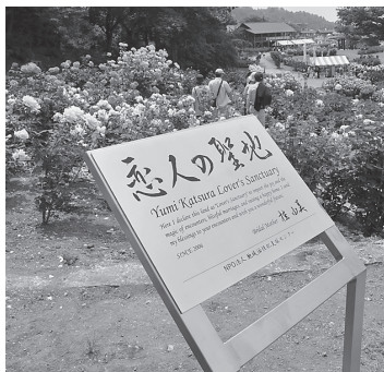
「恋人の聖地」プレートを設置

約7ヘクタールの広さに世界各国の 約750品種、2万株のバラが咲き香る まつり期間は7月5日(日)まで