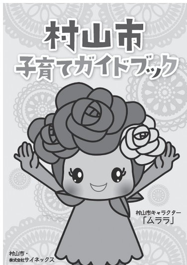
子育てガイドブックの表紙

ガイドブックには、市外から転入した方でも子育て関係施設の場所がわかるように地域ごとの地図や今年度から始まった新しい支援事業、変更した手当などについても掲載しています。市内の保育園、幼稚園、児童センターなどの保育・教育施設や小学校でも配布するほか、市のホームページからダウンロードすることもできます。表紙はMULALAです。みなさんぜひ、ご利用ください。