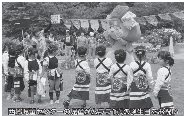
西郷児童センターの児童がムララ1歳の誕生日をお祝い

いきましよう」とあいさつ。その後、志布市長、平観光物産協会長、海老名市議会議長、能登県議会議員が代表し、テープカットでオープニングを祝いました。引き続き、西郷児童センターの年長児14人が徳内ばやしの踊りと「公園にいましよう」の歌を披露すると、園児たちの力強い踊りとかわいらしい歌に、出席者からは大きな拍手が送られていました。