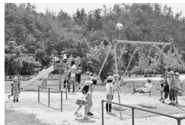
新しい遊具で遊ぶ戸沢保育園の園児