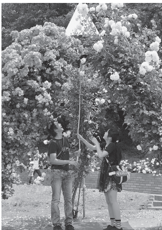
恋人たちに人気のローズベル