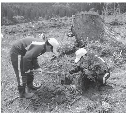
植林体験でスギの苗を植える生徒たち

今年で34回目となる「ふるさと教育の森」が、6月2日から4日に山の内地区の国有林でおこなわれました。参加したのは市内の全中学生688人。午前中に植林体験、午後からは森に親しむ講座を受講できる森林教室を実施しました。植林体験では、67アールの面積に3日間でスギ1260本、ブナ140本の苗を植栽。生徒たちは慣れないくわを使い、一本一本丁寧に苗木を植えていました。また「植栽した苗が森になるのは約60年後」という話を聞き、改めて森の大切さを感じていました。