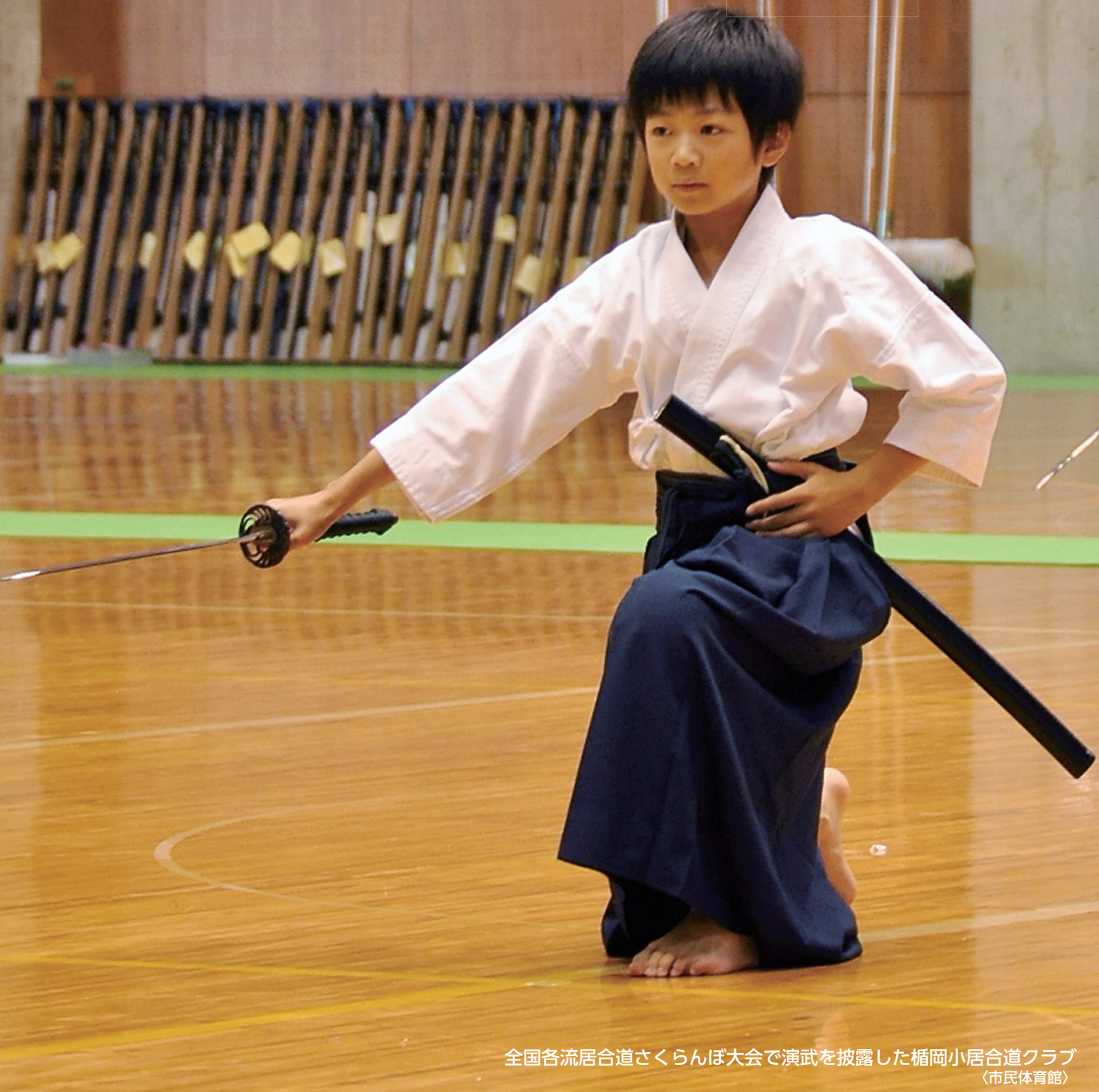
全国各流居合道さくらんぼ大会で演武を披露した楯岡小居合道クラブ (市民体育館)

村山市役所 TEL:55-2111(代) FAX:55-6443 www.city.murayama.lg.jp