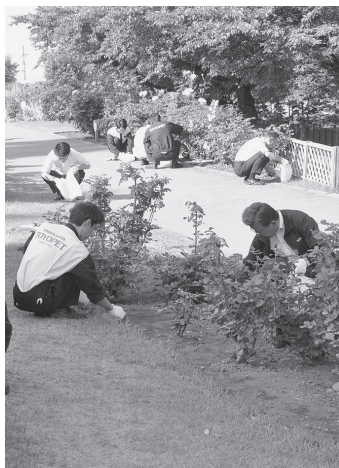
企業も参加したクリーンアップ