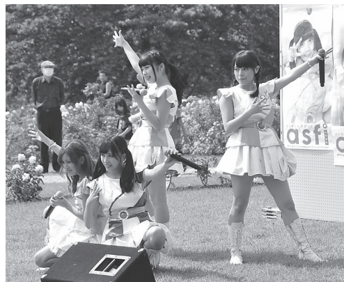
アイドルグループ「asfi」のコンサート