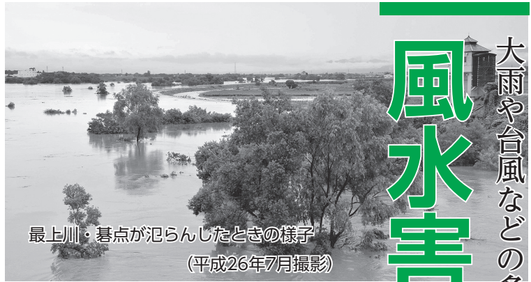
最上川・基点が氾らんしたときの様子 (平成26年7月撮影)

梅雨や台風などの雨・風による災害が発生しやすい季節となりました。最近、局地的な大雨により、人的被害や住宅などの家屋の被害が発生しています。気象情報や危険な前ぶれに注意し、「自分の身は自分で守る」「地域で協力しあって助け合う」という意識を持って、家族や地域で日ごろから防災について関心を高め風水害に備えましょう。