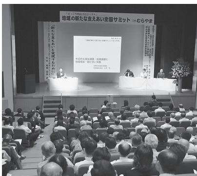
300人が参加したシンポジウム

市社会福祉協議会が主催する「ほっこり村山プロジェクト・地域の新たな支え合い全国サミット in むらやま」が6月12日、13日に開催され、市内外から延べ500人が参加しました。これは、中央共同募金会から助成を受け実施したものです。初日は市民会館で新たな支え合いを実現するための課題や地域福祉活動などについてのシンポジウムが開催されました。二日目は、甌葉プラザで9つの分科会に分かれ、いきいきサロンや子育て支援などをおし、参加者同志の情報交換や交流を図りました。