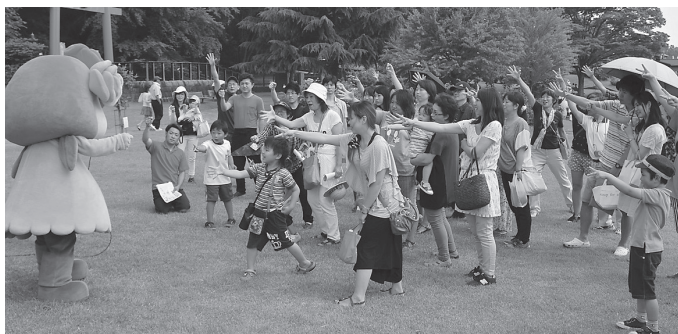
「ムララと遊ぼう」で盛り上がったジャンケン大会

約7ヘクタールの広さに世界各国の 約750品種、2万株のバラが咲き香る まつり期間は7月5日(日)まで