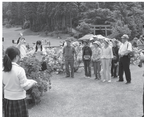
高校生の園内ガイドボランティア