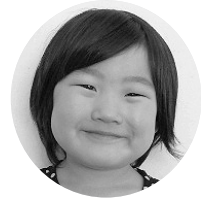
いたがきさきちゃん