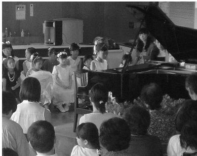
昨年のチャイルドピアノコンサートの様子

■常設展示室 最上川Ⅱ 期間 6月26日(金)～9月8日(火) ■企画展示室 村山市美術連盟作品展 市美術連盟のみなさんによる作品展です。 期間 6月26日(金)～7月21日(火) ■チャイルドピアノコンサート 市内や近隣でピアノを習っている子どもたちが、日頃の練習の成果を発表します。 日時 7月11日(土)午前9時30分～