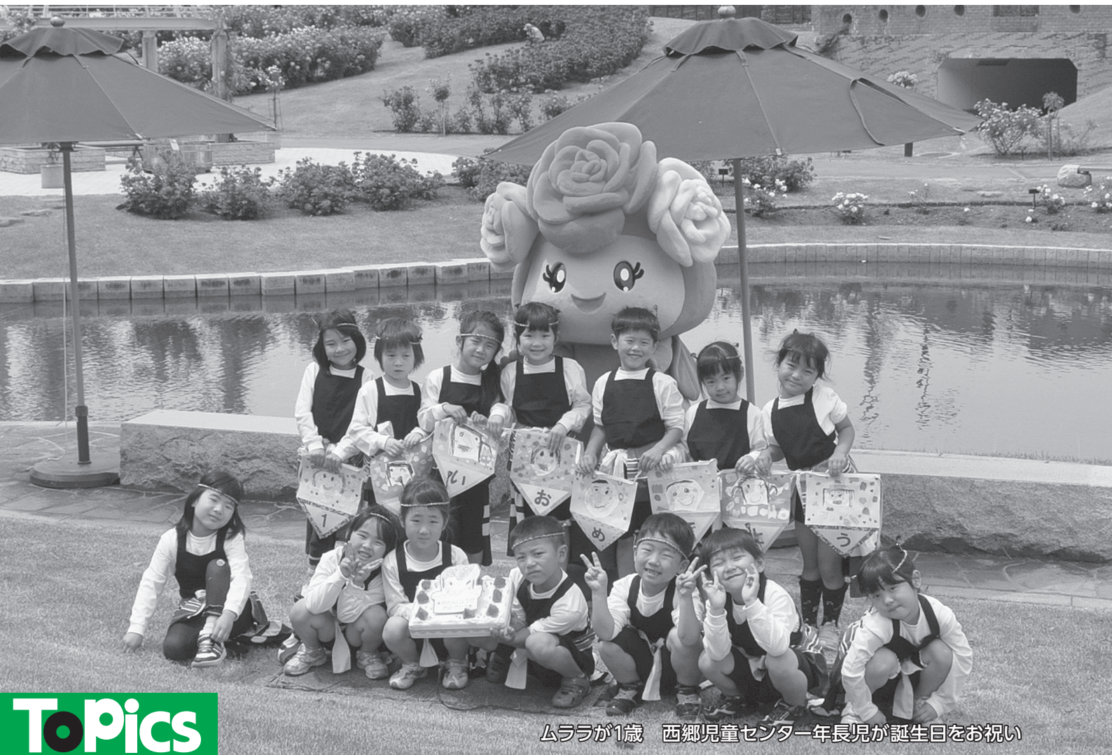
ムララが1歳 西郷児童センター一年長児が誕生日をお祝い

村山市役所 TEL: 55-2111 (代) FAX: 55-6443 www.city.murayama.lg.jp