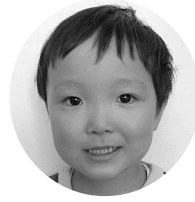
こせきとうまくん