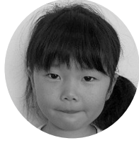
おちあいかんちゃん