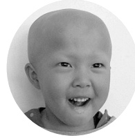
くろめいおりくん