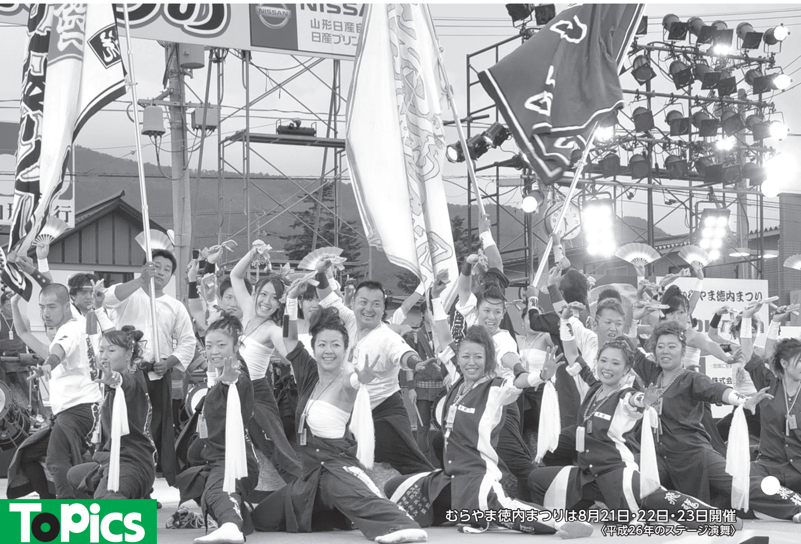
むらやま徳内まつりは8月21日・22日・23日開催 《平成26年のステージ演舞》