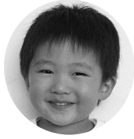
あらかれいとくん