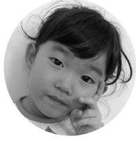
くきこはるちゃん