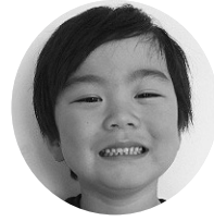
あしのとうりくん