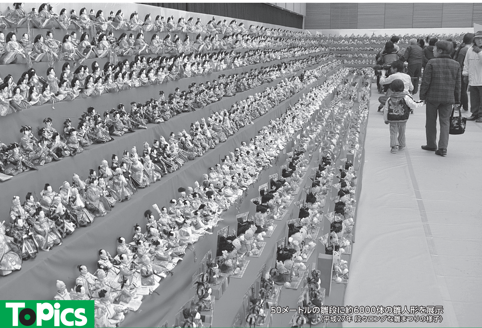
50メートルの雛段に約6000体の雛人形を展示 (平成27年 段々ロングな雛まつりの様子)

村山市役所 TEL: 55-2111 (代) FAX: 55-6443 www.city.murayama.lg.jp