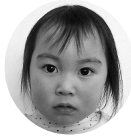
かるべももはちゃん