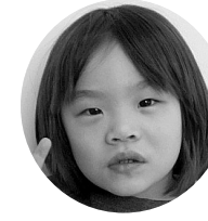
ほそやまおちゃん