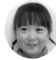
まつだいとちゃん