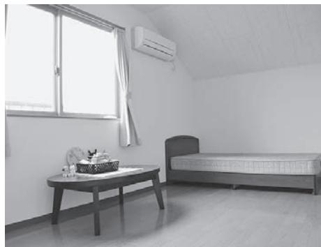
ベテスダキッズの病児保育室

原則、市内にお住まいの方、または保護者が市内にお勤めの方で、生後6か月程度から小学校6年生までのお子さんが利用できます。定員は2人です。