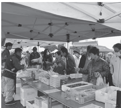
たくさんのお客様でにぎわう厚岸町のコーナー

祭りの最後には、村山市と厚岸町の物産が当たる抽選会もおこなわれ、会場は最後まで多くのお客様でにぎわいました。