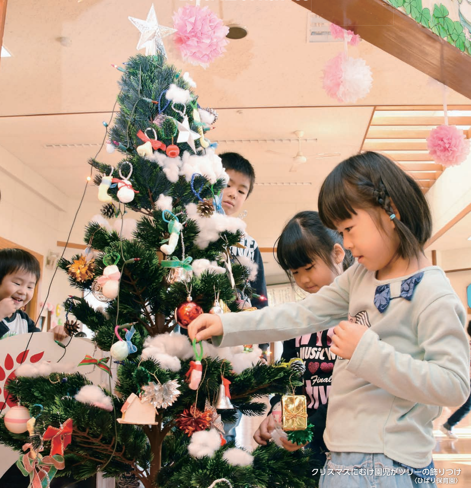
クリスマスにむけ園児がツリーの飾りつけ (むげり保育園)

村山市役所 TEL: 55-2111 (代) FAX: 55-6443 www.city.murayama.lg.jp