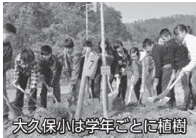
大久保小は学年ごとに植樹