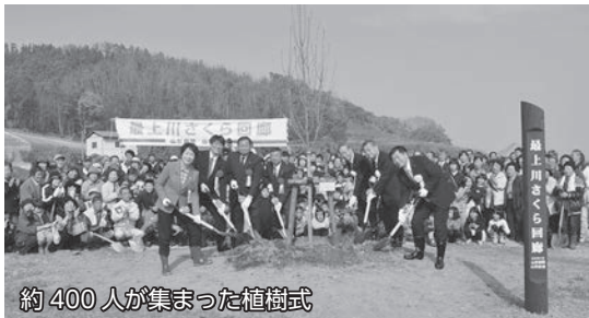
約400人が集まった植樹式