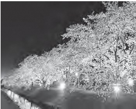
艶やかにライトアップされた桜

可憐な花びらたちは様々な光に照らされ、幻想的な雰囲気を出し、日中に見る桜とは一味違った姿を見せ、訪れた人々の心を魅了していました。