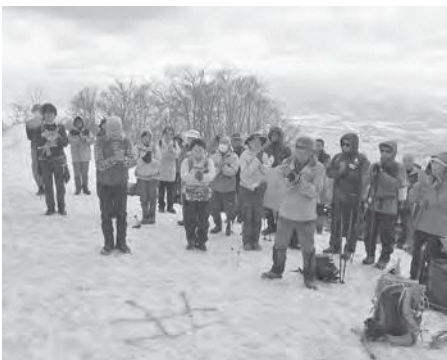
参加者が山頂で神事を行う様子

当日はあいにく曇りの天気でしたが、頂上が近づくにつれ雄大な景色が眼下に広がると、参加者からは歓声が上がリ、笑顔が広がっていました。