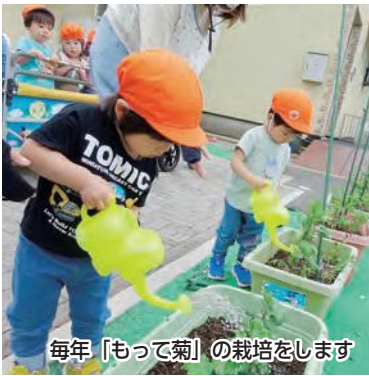
毎年「もって菊」の栽培をします