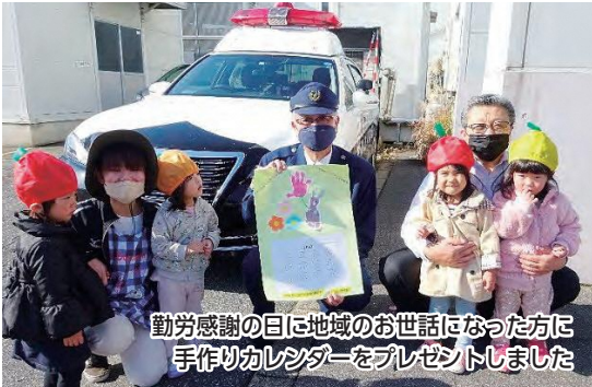
勤労感謝の日に地域のお世話になった方に 手作りカレンダーをプレゼントしました