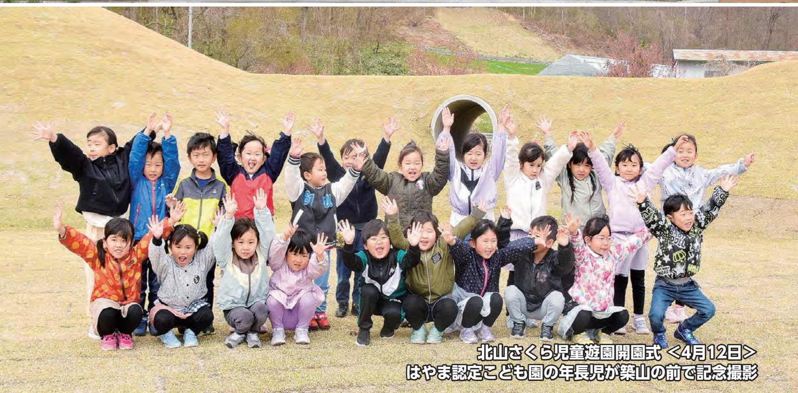
北山さくら児童遊園開園式 <4月12日> はやま認定こども園の年長児が築山の前で記念撮影