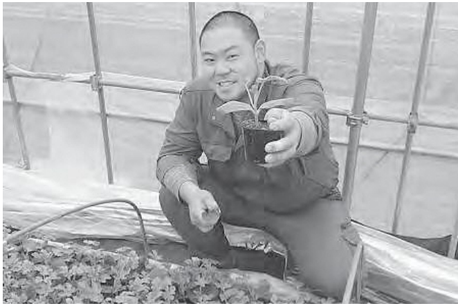
隊員2年目です。今年も頑張ります！