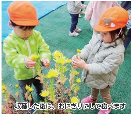
収穫した後は、おにぎりにして食べます