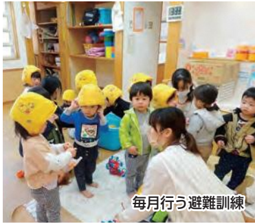
毎月行う避難訓練