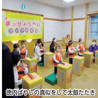
徳内ばやし我真似をして太鼓たたき