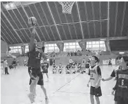
楽しくプレーする参加者

卒業シーズンでの開催となり、この春に中学校・高校を卒業した参加者にとっては、同じ学校の仲間との思い出が増え、それぞれ有意義な時間を過ごしていました。