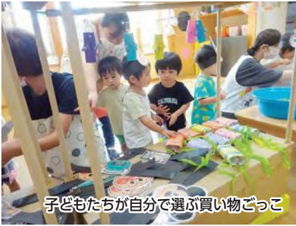
子どもたちが自分で選ぶ買い物ごっこ