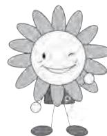
市健康づくりキャラクター ほっぴー