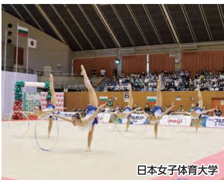
日本女子体育大学