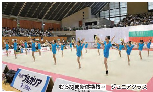
むらやま新体操教室 ジュニアクラス