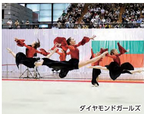
ダイヤモンドガールズ