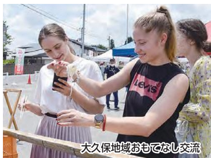
大久保地域おもてなし交流