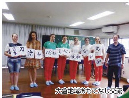
大倉地域おもてなし交流