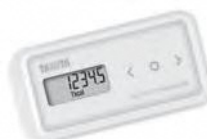
タニタの活動量計

★今回限り先着100名に『からだにいいお菓子パック(1,000円相当)』プレゼント