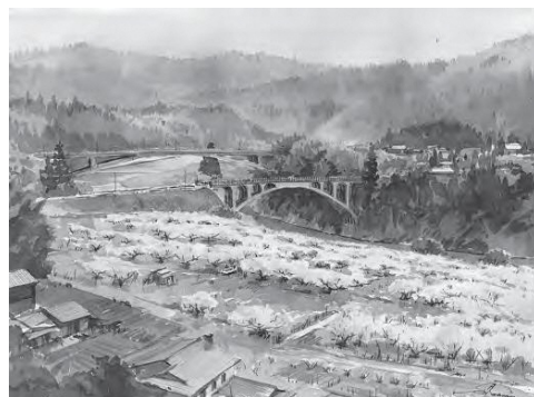
「新旧眼鏡橋」(朝日町) 柴田治作

定員 10名程度 (中学生以下は保護者同伴) ※電話または右記の申込みフォームよりお申し込みください。