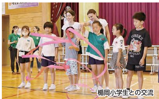
楯岡小学生との交流