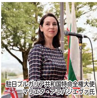
駐日ブルガリア共和国特命全権大使 マリエタ・アラバジエヴァ氏