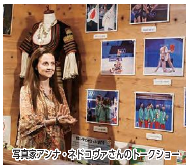
写真家アンナ・ネドコヴァさんのトークショー