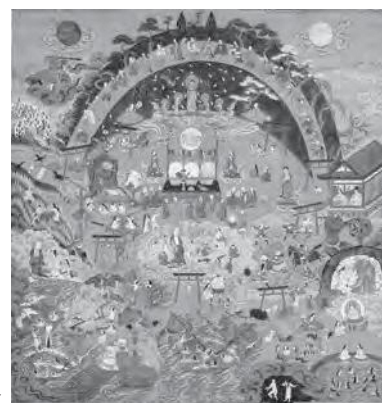
熊野観心十界曼荼羅→