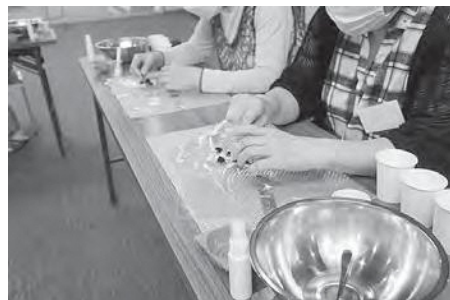
昨年の家族介護者交流会の様子 (ローズティー作り)