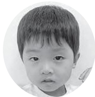
いたがき あよとさん