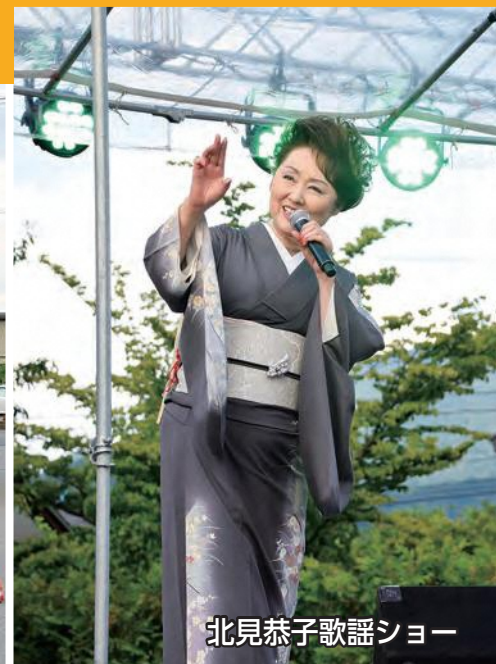
北見恭子歌謡ショー