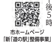
市ホームページ [新「道の駅」整備事業]

必ず指定の意見提出用紙に必要事項を記入のうえ、直接または郵送(必着)、FAX、メールでまち整備課まで提出ください。