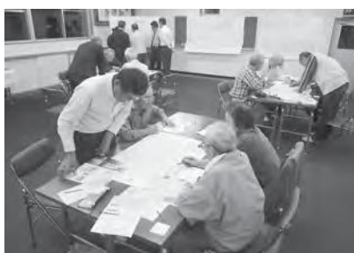
歴史文化について語り合う様子

策定の過程では、各地域に残された文化財の調査・整理や市の歴史に関する講演会などを実施するとともに、各地域の歴史について住民同士が語り合うイベント「れきぶんワーク」や文化財の活用方法を考える「利活用検討会議」、歴史文化の事例発表やシンポジウムを行った「れきぶんフェス」などを開催し、行政と市民が一体となって策定事業を進めてきました。