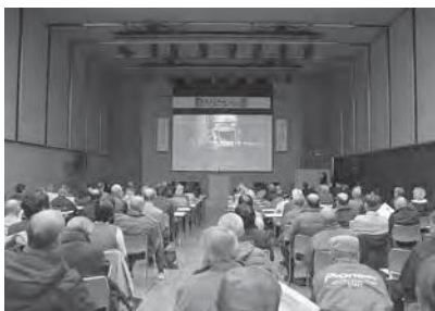
れきぶんフェスの様子