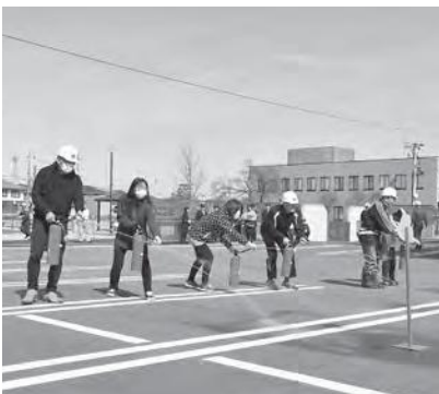
初期消火訓練を行う防災訓練参加者

初期消火や避難誘導訓練、医療救護訓練、災害時でも調理できる料理の炊き出し、ミキサー車を使った消火用水補給訓練などを行い、災害時における防災体制の確立と防災意識の高揚を図りました。