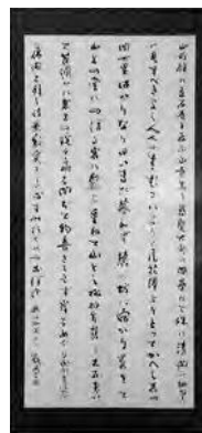
高梨甌竹書「奥の細道より」