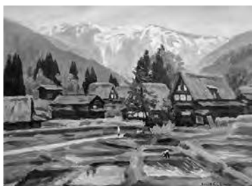
真下慶治作「初夏の合掌造り」