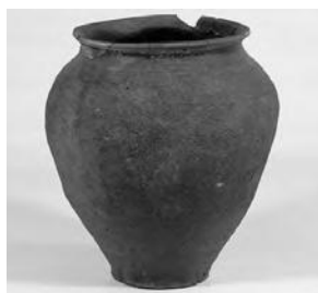
経筒外容器(河島山経塚)

■最上川芸術祭 Best Of River Art Festival 〜大海に向かって流れよう!〜 洋画家 真下慶治作品展示のほか、アーティスト「もりわじん」氏や、写真家、陶芸家、ダンサーなど、いろいろなジャンルのアーティストたちが最上川美術館で型にはまらない多面的な魅力を発信します。 期間 11月8日(金)~12月10日(火)