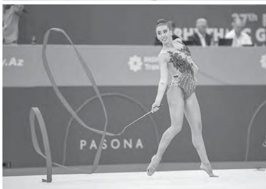
世界新体操選手権大会2019 演技の様子 ポリャナ・カレイン選手(写真上)、カトリン・タセヴァ選手(写真下)

9月16日から22日までアゼルバイジャン・バクーで開催された世界新体操選手権大会2019で、ブルガリアチームのポリャナ・カレイン選手とカトリン・タセヴァ選手の2人が、東京2020オリンピックへの個人競技出場権を獲得しました。