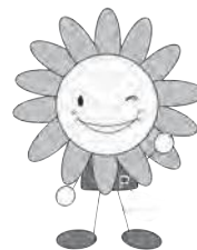
市健康づくりキャラクター ぽっぴー