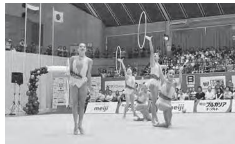
7月15日公開演技会でのブルガリアチーム団体種目の様子

■明治キャンペーン事務局 ☎0120-660-157(平日の9:00～17:00)