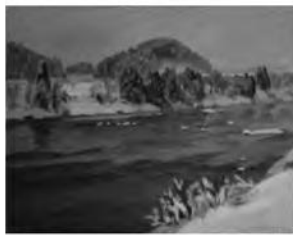
真下慶治作「最上川 一基点一」