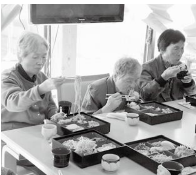
新そばを味わう利用者の皆さん

「刈りたて・ひきたて・打ちたて・茹でたて」と4拍子そろった新そばの味は格別で、利用者の皆さんは、香りを楽しみながらおいしく味わっていました。