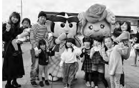
ムララと北海道厚岸町のキャラクター「うみえもん」と記念撮影