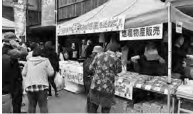
塩竈市の物産販売