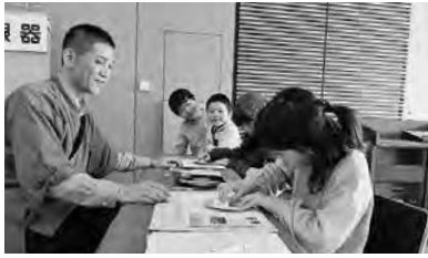
台東区の江戸下町伝統工芸職人展 体験コーナー