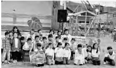
農作物体験を発表した榎岡小、袖崎小の児童