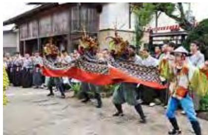
天神湯野沢鹿の子踊

市の南西部に位置する富本地域には、葉山と熊野、二つの信仰の歴史が残されています。北部の岩野地区は、江戸時代には上野村と呼ばれ、当時出羽三山の一つとされていた葉山信仰の表参道として栄えた村でした。多くの参拝者が行き交い、12の宿坊があったと伝えられています。現在でも上ノ宿や上仲宿、下仲宿といった地名にその名残をとどめるだけでなく、千座川沿いの道を登っていくと、参拝者へ向けた複数の石碑を見ることができます。旧葉山キャンプ場の先には、信仰の中心として隆盛を誇った葉山大円院跡があり、今なお霊妙な雰囲気を残しています。 南部の湯野沢地区は、かつて山中から湯が湧き出したことが名前の由来とされています。湯野沢熊野神社は、約800年前に創建され、本殿と拝殿は国の登録有形文化財です。 熊野神社大祭は江戸時代末期から伝承され、湯野沢奴ふりや天神湯野沢鹿の子踊といった伝統の踊りが奉納されています。