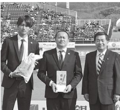
試合前に開催されたセレモニー

この日は、愛媛FCを迎えてのホームゲーム。村山市からは応援無料バスも運行し、大勢の市民がバックスタンド席から熱い声援を送りました。試合は、3対0でモンテディオ山形が勝利。クラブ通算1、000ゴール目のメモリアルゴールも飛び出し、大いに盛り上がりました。