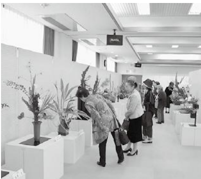
色鮮やかで個性豊かな作品が並んだ合同いけばな展

すてきな花々であふれた会場内は和みと癒しに包まれ、訪れた方々は、その色鮮やかで個性豊かな作品の数々にじっくりと見入っていました。