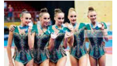
⑦団体競技で東京オリンピック出場枠獲得