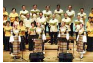
⑧アバガル・カルテット公演