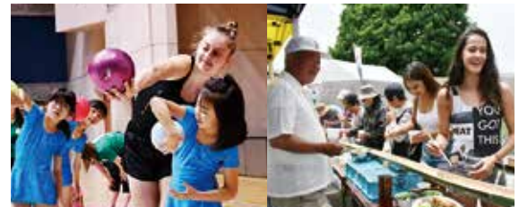
選手が子どもたちに指導