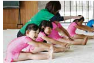
⑨むらやま新体操教室