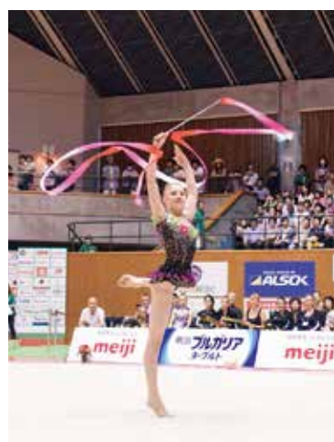
⑦ ROSE CAMP2017