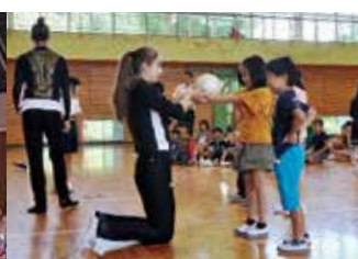
選手たちによる学校訪問