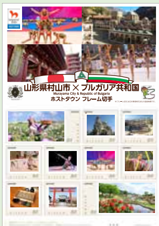
⑮ホストタウンフレーム切手 1部1,330円（限定500部） 市内郵便局で販売中です。 ぜひ、お買い求めください。