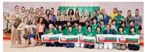
選手とボランティア ⑩ ROSE CAMP 2019 の皆さん