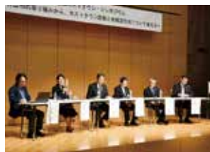
全国ホストタウンシンポジウム