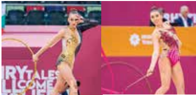
⑭個人競技で東京オリンピック出場枠獲得 ポリャナ・カレイン選手とカトリン・タセヴァ選手