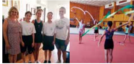
⑪新体操ジュニア強化選手をブルガリアへ派遣