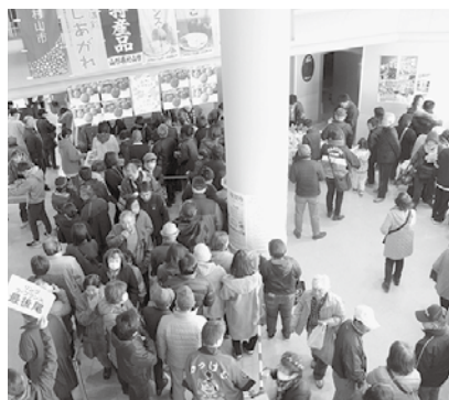
買い求めるお客さんでいっぱいになったコンキリエ

当日は晴天に恵まれ、大勢の町民が来場しました。新米や日本酒、リンゴ、ラ・フランスなどが人気で、商品はすべて完売。ずんだ餅、いも煮、厚岸町のあさり汁、アイスクリーム振舞いも行われ、最後は村山市の特産品が当たる大抽選会を開催し大いに盛り上がりました。