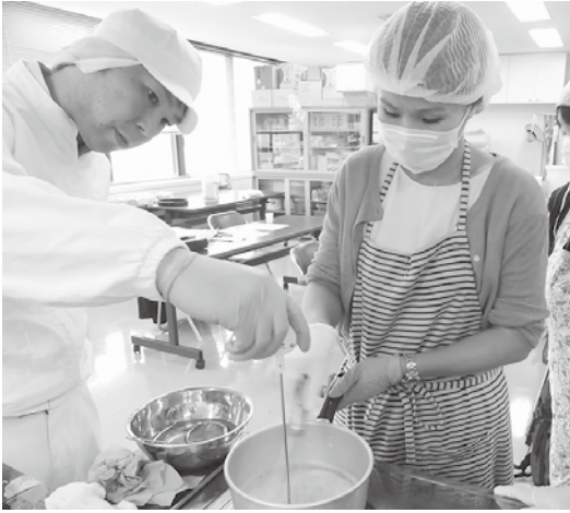
農産物加工技術研修会の様子