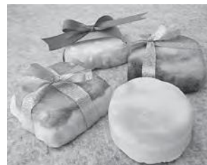
オリジナル石けん