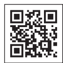
↑子育て支援アプリ