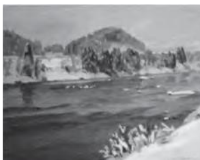
真下慶治作「最上川 一基点一」