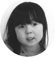
とびた りのんちゃん