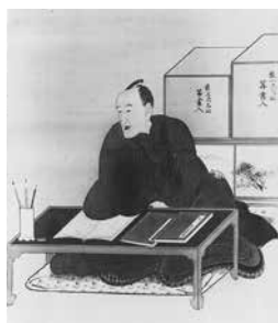
会田安明肖像画（山形大学付属博物館蔵）

休館日/水曜日、6月14日(木) 開館時間/午前9時～午後5時 問合せ/最上川美術館 ☎(52)3195