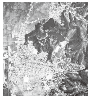
昭和47年撮影の航空写真

■航空写真パネル「空から見た昭和の村山市」展示 昭和22年から50年に撮影した大きな写真パネルを展示します。楯岡、河島、大久保から東根市長瀬までが写っており、民家も確認できます。