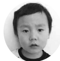
おおいずみ てんまくん