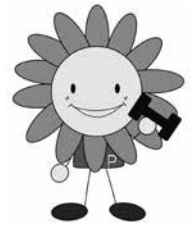
市健康づくりキャラクター ほっぴー