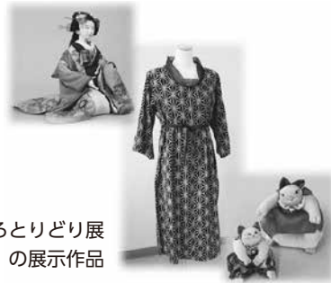
いろいろとりどり展 の展示作品