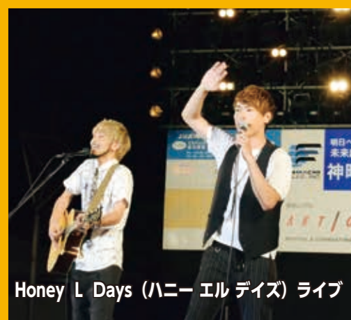
Honey L Days (ハニー エル デイズ) ライブ