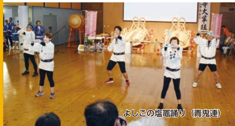
よしこの塩竈踊り (青鬼連)