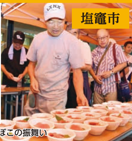
まぐるとかまぼこの振舞い