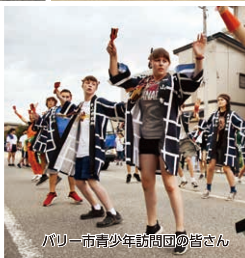
パリー市青少年訪問団の皆さん