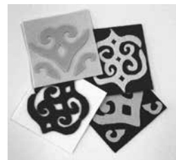
アイヌ文様のコースター