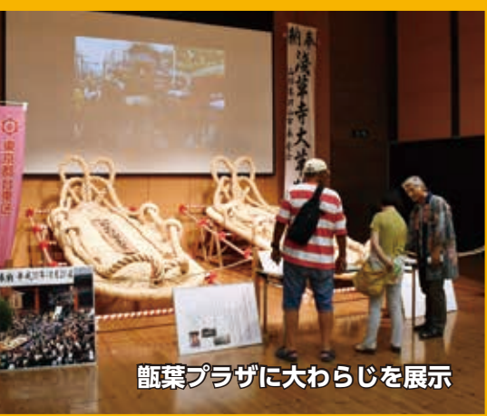
蕨葉プラザに大わらじを展示