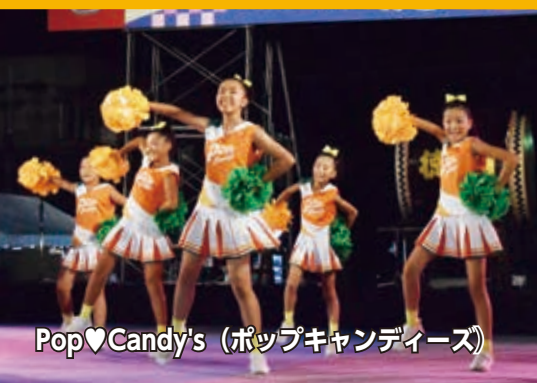
Pop♥Candy's (ポップキャンディーズ)