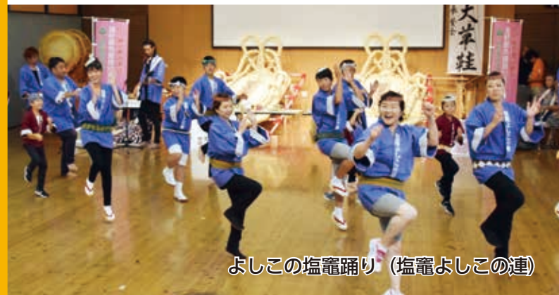
よしこの塩竈踊り (塩竈よしこの連)