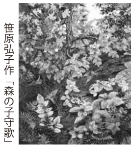
笹原弘子作「森の子守歌」