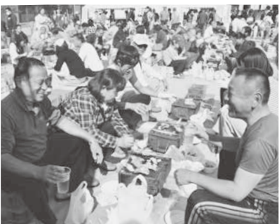
厚岸直送かきまつりのコーナーでは、カキやサンマ、アサリを炭火で焼いて楽しみました

厚岸町商工会との姉妹商工会締結25周年を記念したむらやま商工まつり・厚岸直送かきまつりが10月14日、甌葉プラザとふれあい広場で開催され、カキなどを焼いて楽しむ来場者で会場は大いに賑わいました。商工会員によるさまざまな出店のほか、甌葉ホールでは東京都台東区の職人たちが「江戸すだれ」「江戸銅器」などの制作を上演。また台東区との友好都市提携10周年を記念し、大わらじ製作や、台東区との交流を紹介するパネル展も開催しました。