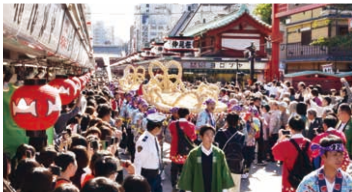
仲見世は奉納行列を見物する人たちでいっぱい