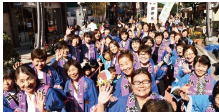
奉納行列に参加した楯岡荒町地区の皆さん