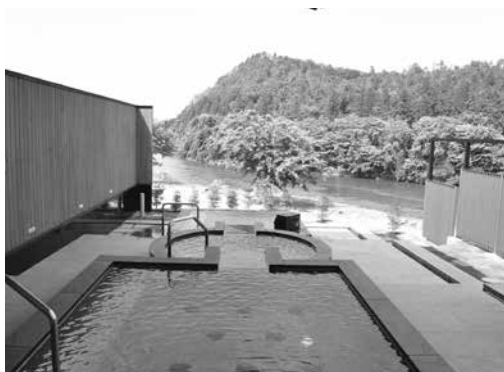
最上川を真近に臨む露天風呂

泉質はナトリウム・カルシウムを含む塩化物泉。保温効果が高い温まりの湯です。神経痛や筋肉痛、五十肩のほか、きりきず、やけどなどにも効能があると言われています。大浴場は温度が高めの浴槽と、リラッ