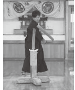
試し斬り体験の様子