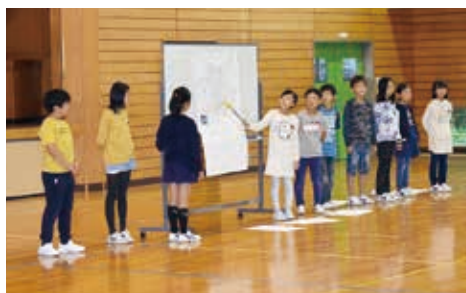
↑全校発表会の様子

戸沢小学校が目指すのは「疑問を大切に して、自分の考えを説明できる子ども」。 読書活動により、本を使って「調べる力」 が付き、たくさんさんの文章を読むことで「ま とめる力」が育まれ、語彙力がつくことで 「伝える力」の向上へとつながります。全 校発表会などでの子どもたちの成長を見る と、読書の大切さを強く感じます。自分の 考えをしっかりと表現できる子どもにも育つよ う、今後も活動を進めていきます。