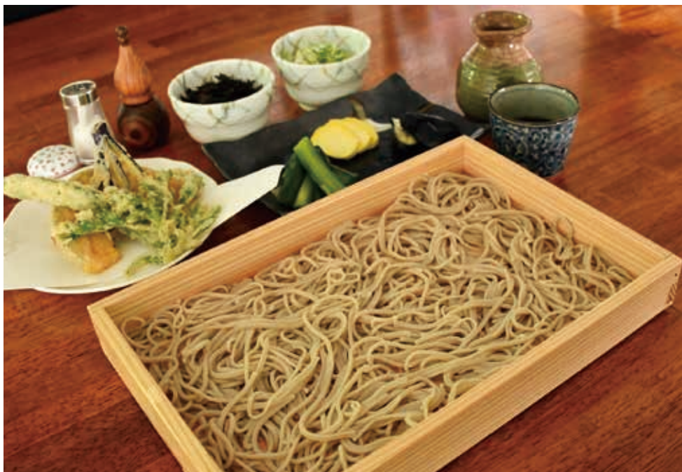
住所：河島乙99 電話：55-6663 営業時間：午前11時～午後2時（そば打ち体験は午前10時～） 定休日：火曜日