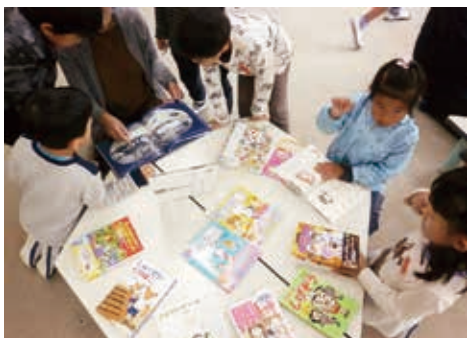
↑購入する本を子どもたちが選ぶ選書会