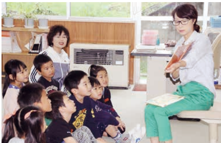
↑地域ボランティアの皆さんによる読み聞かせ