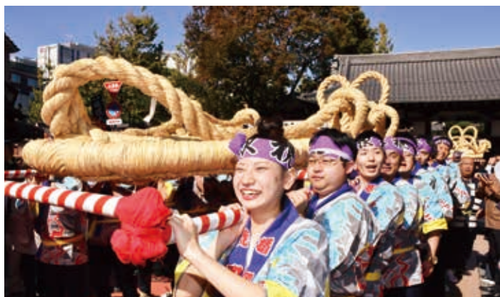
楯岡荒町地区の皆さんに担がれ、大わらじが伝法院を出発