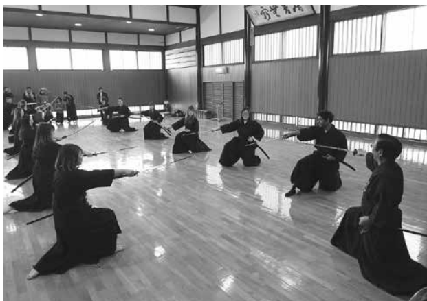
居合道体験会の様子