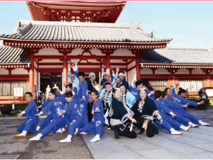
五重塔前で荒町あ組が徳内ばやしを披露