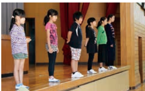
↑全校児童の前で自分の目標を発表