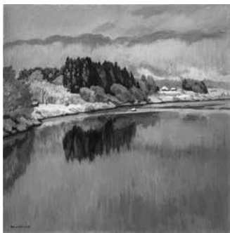
真下慶治作「最上川雪霽」