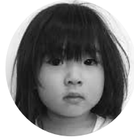
そりまち みとちゃん