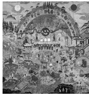
熊野観心十界曼荼羅 (松念寺所蔵)