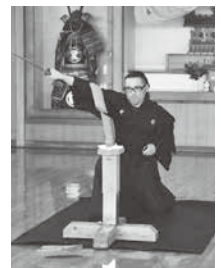
試し斬り体験の様子