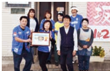
前列左から勲さん、典子さん、高行さん、前列右・後列は従業員の皆さん