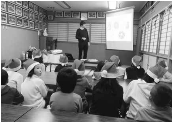
はや丸キッズクラブのクリスマス会に招待してもらい、オランダのクリスマスについてお話ししました。