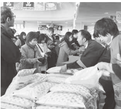
買い求めるお客さんでいっぱいになったコンキリエ

当日は晴天に恵まれ、大勢の町民が来場しました。新米やリンゴ、ラ・フランスなどが人気で、1時間もたないうちに完売。ずんだ餅、いも煮、厚岸町のあさり汁振舞いも行われ、こちらも長蛇の列をなしていました。最後は村山市の特産品が当たる大抽選会を開催し大いに盛り上がりました。