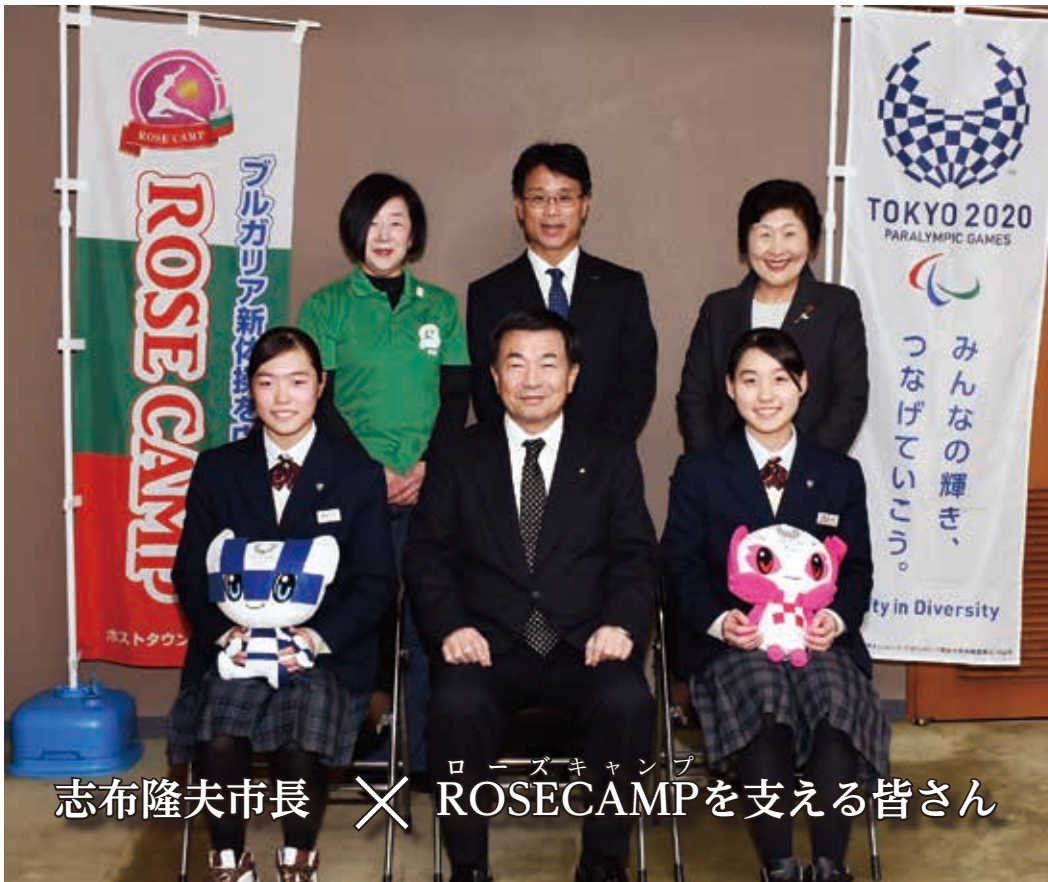
志布隆夫市長 × ROSECAMPを支える皆さん

東京2020大会に向けた全国初の事前キャンプとして注目を集めたローズキャンプ。ブルガリアの新体操チームによるこのキャンプは、今年で3回目を迎えます。ローズキャンプをさらに盛り上げ、今後のホストタウン事業につなげていけるよう、志布市長とキャンプに関わる5人の方がそれぞれの活動や感じたことなどについて語り合いました。