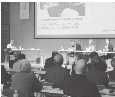
「葉山信仰と熊野観心十界曼茶羅」について話し合ったパネルディスカッション

市は、地域の歴史遺産を再発見し、まちづくりを生かすことを目的に昨年度から歴史文化基本構想の策定に取り組んでいます。12月16日にはそのシンボル事業として、甌葉プラザで「れきぶんフェス2018」を開催し、歴史文化関連団体の活動紹介や、市内に残る貴重な熊野観心十界曼茶羅 くまのかんじんじゅうがいまんぢら についての講演、パネルディスカッションを実施。熊野観心十界曼茶羅に描かれている世界観や市内に現存する理由について話しました。歴史文化基本構想は今年度中に策定する予定です。