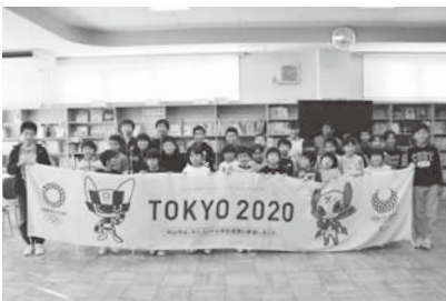
「ミライトワ」と「ソメイティ」がデザインされた横断幕を囲んで袖崎小学校児童全員で記念撮影

横断幕はリレー形式で小学校に掲示。11月27日には、最初の掲示所となる袖崎小学校で授与式が行われました。横断幕は2週間ずつ各小学校を移動し、3月まで掲示します。