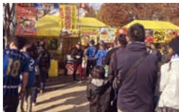
モンテディオ山形試合会場では店に長い行列