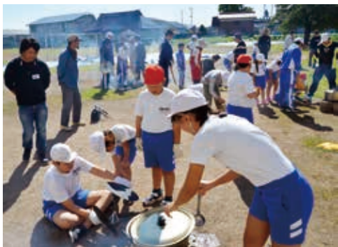
↑地域の皆さんにも煮とおにぎりを振る舞ったいも煮会