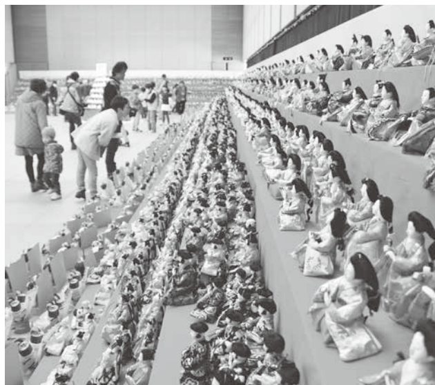
段々ロングな雛まつり