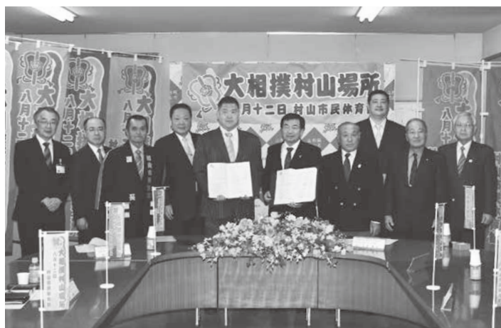
興業契約締結式の出席者で記念撮影。