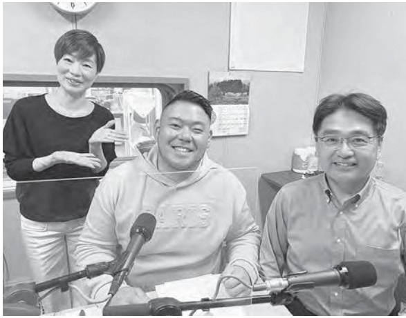
羽間アナウンサー(右)、岩田アナウンサー(左)とのNHKラジオ収録をしてみました