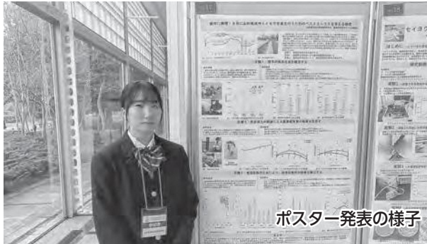
ポスター発表の様子

また、サトイモ・芋煮研究班はポスター優秀賞を受賞するなど素晴らしい結果を残してくれました。