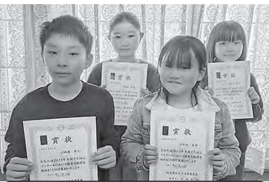
そろばんコンクール金賞

https://www.instagram.com/uzy_photostyle_j