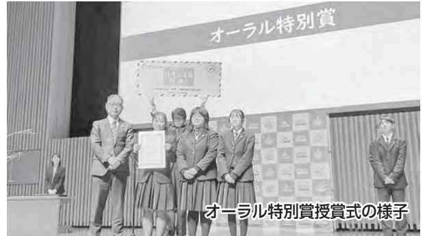
オーラル特別賞授賞式の様子