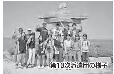
第10次派遣団の様子