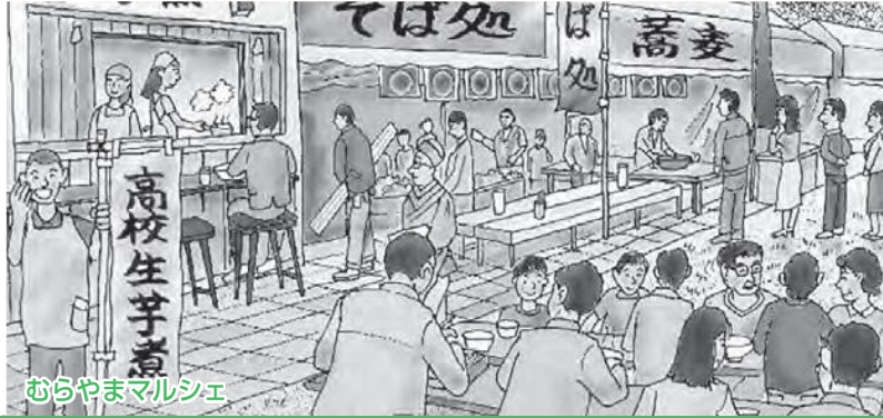
むらやまマルシェ