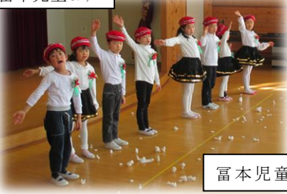
富本児童センター