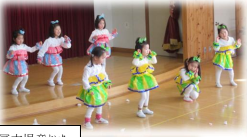
富本児童センター

多くの団体等からご参加いただきました。日頃の練習の成果を発揮し、観客を楽しませてくれました。