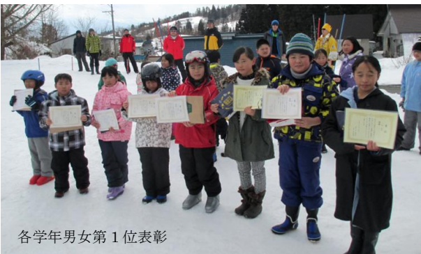
各学年男女第1位表彰