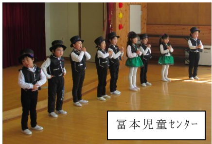
富本児童センター