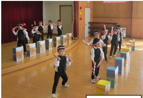
富本児童センター

多くの団体等からご参加いただき、ありがとうございました。日頃の練習の成果を發揮し、観客を楽しませてくれました。