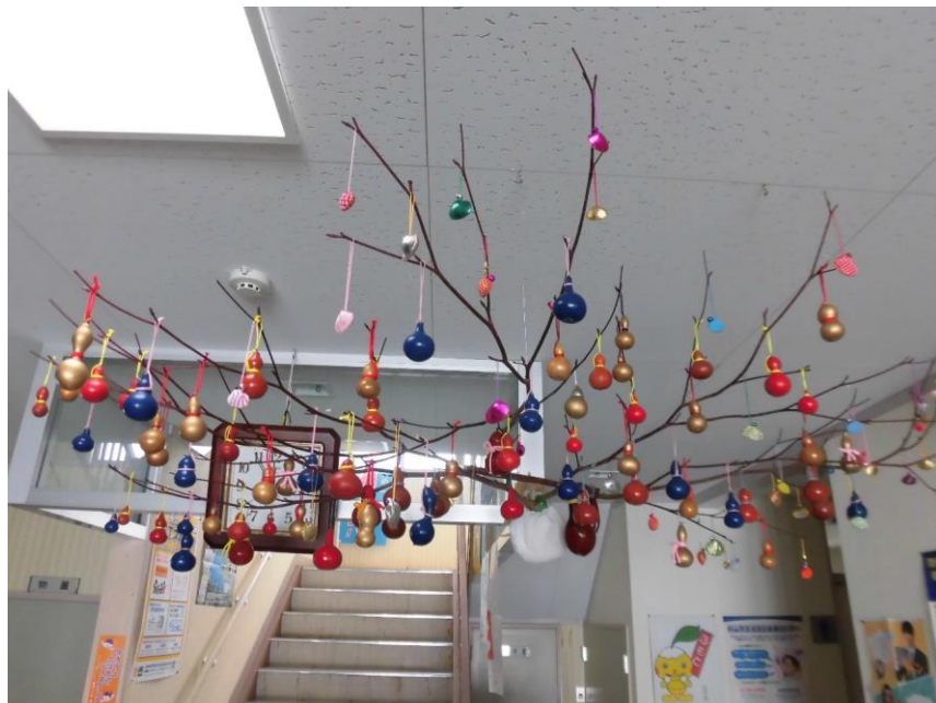
大人の雰囲気のだんご木です。ぜひご覧ください！

お二人からは平成29年から毎年提供いただいております。今年で5年目となります。市民センターに2月下旬まで飾ります。