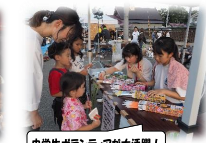
中学生ボランティアが大活躍！