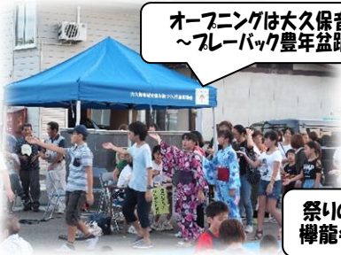
オープニングは大久保音頭♪ ～フレーバック豊年盆踊り～