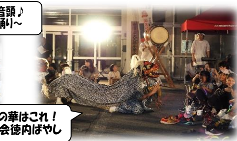
祭りの華はこれ！ 榊籠会徳内ぼやし