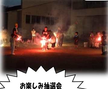
お楽しみ抽選会 夏祭り特別賞（高級 布団乾燥機）おめで とございます！！