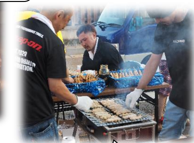
経営研究会の売店！ まいと、ありがとう ございます