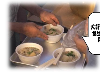
大好評のどん汁！