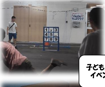
子ども向け イベント