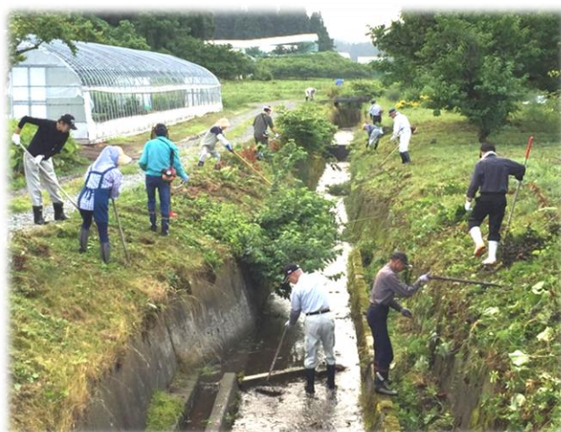
四谷川の清掃（金谷地区）

大倉地域においても、早朝より住民の方々が総出で、河川沿いの草刈りや清掃などを行いました。今後とも美しい郷を継続できますようご協力お願いいたします。ご参加いただいた皆さま、大変ありがとうございました。