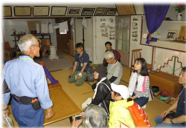
中沢阿弥陀堂にて

次回のイベントは、9月9日（日）中沢の棚田コースで開催します。皆さんの参加を心よりお待ちしております。 （詳しくは大倉地域市民センターまで）