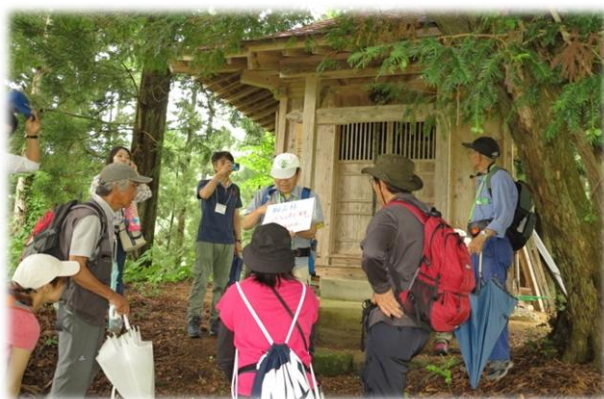
新山観音堂前での解説

7月8日（日）、今年2回目のフットパスイベント（甌岳修験と古の精霊たちコース）が開催されました。市内外から13名（20代から80代）の方に参加いただき、約8kmのコースをガイドの説明を聞きながらゆっくり散策しました。