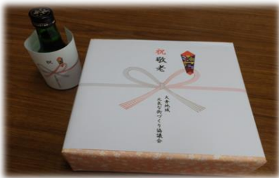
街協女性部敬老お祝い品の準備風景