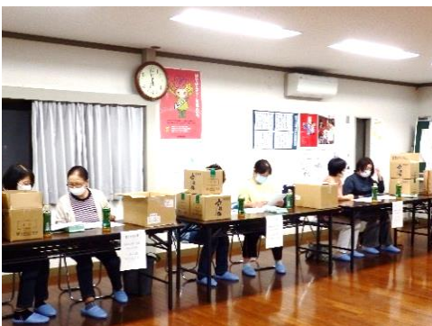
街協女性部 敬老お祝い品準備風景