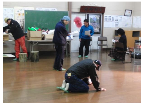
『洗心座』 演劇稽古の様子