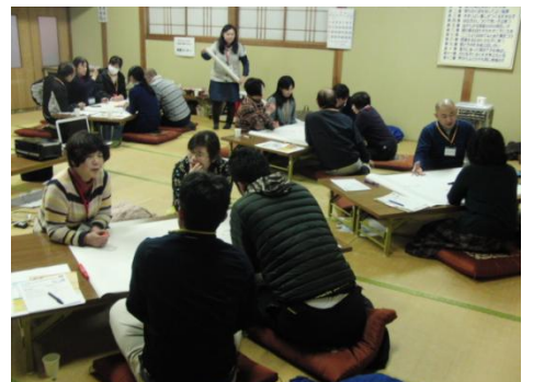
1/13 開催 第1回 地域の集い