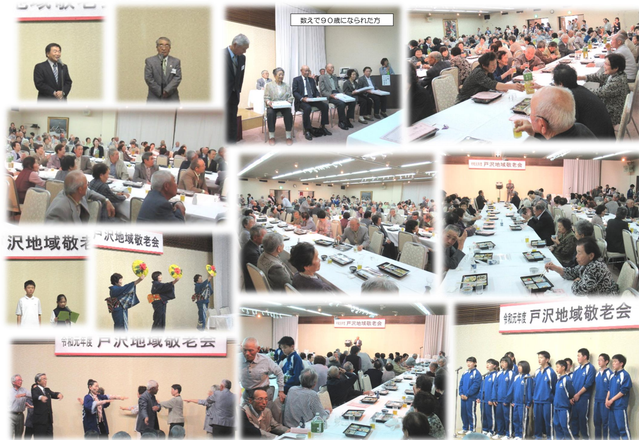
数えて90歳になられた方

その後に行われた祝宴では、友志会による踊りの披露や出席者による踊り・カラオケ等が行われ、賑やかな会場で皆さん会話や食事を楽しまれました。これまで、戸沢地域を支えてこられた大先輩方、これからも元気で活躍いただきたいと思います。