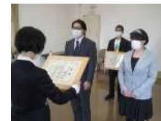
授与式の様子（文翔館にて）