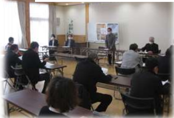
まちづくり協議会理事会（4月6日開催）の様子

これまで同様、地域の皆さまの意見を取り入れながら一緒に地域づくりを進めていきたいと思っておりますので、ご協力よろしくお願いたします。