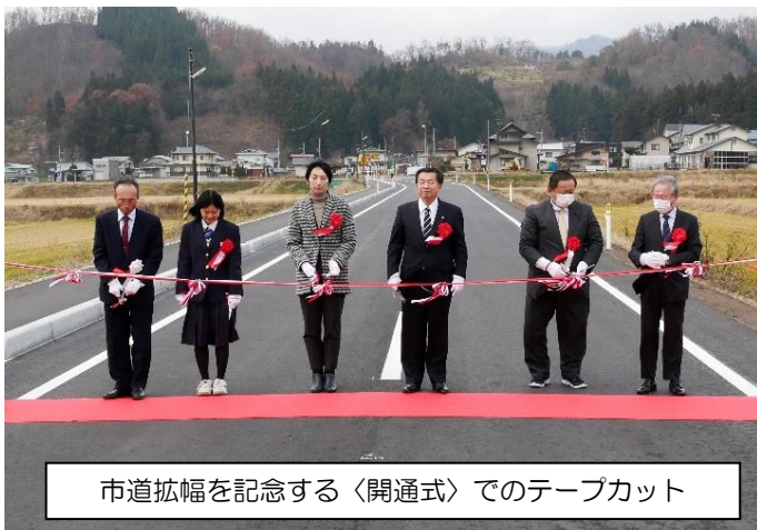
市道拡幅を記念する〈開通式〉でのテープカット

これに伴い、大字稲下会で12月10日(日)に『市道稲下久保田線開通式・完成祝賀会』を、現地と稲下会館にて行いました。